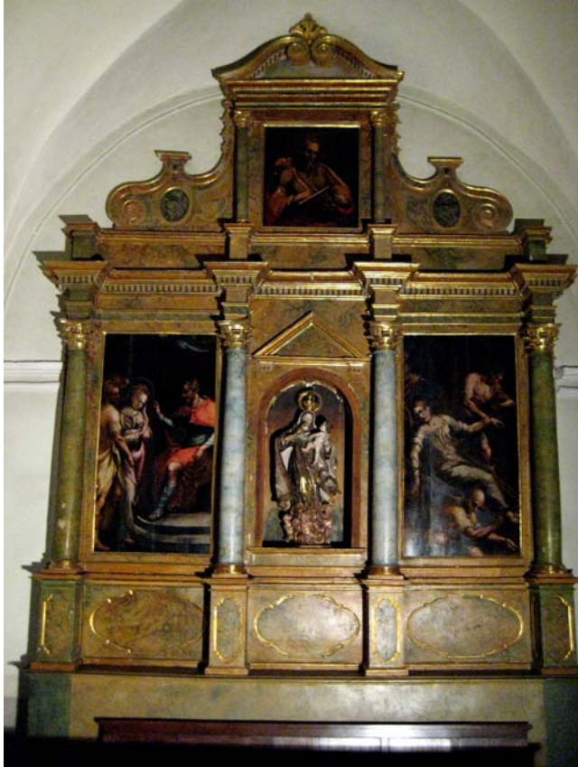
Retablo de la Virgen del Carmen