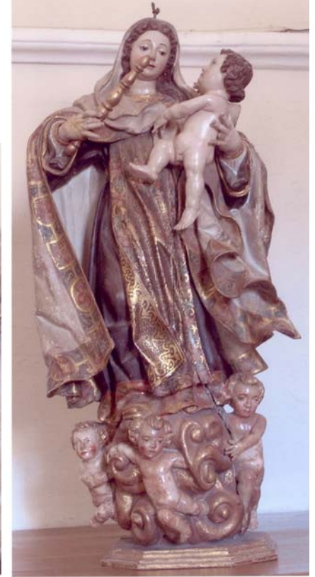
Virgen del Carmen