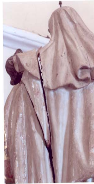
Detalles del deterioro de la imagen de la Virgen del Carmen