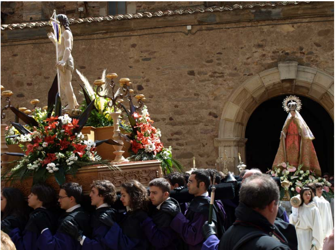
Encuentro del Resucitado y la Virgen del Amor Hermoso 2009