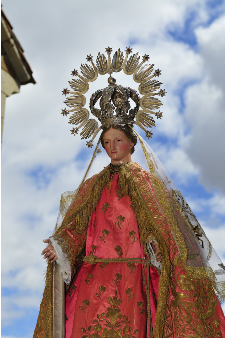
Imagen de Ntra. Sra. del Amor Hermoso, en el día de Pascua de 2009